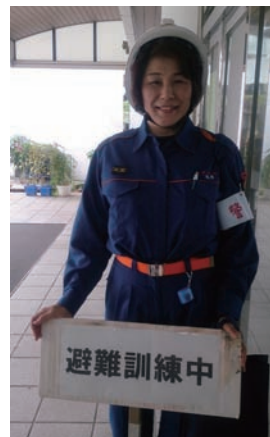
◀大震災の教訓を風化させまいと、防災訓練への参加を呼びかけています