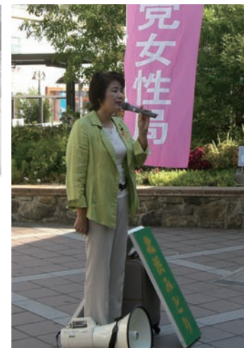
◀街頭活動も積極的に展開。県政による灘区での取り組みをPRしています