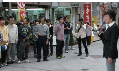
▲障害者就労支援B型施設のマブイ六甲が水道筋商店街に100円均一ショップを開設