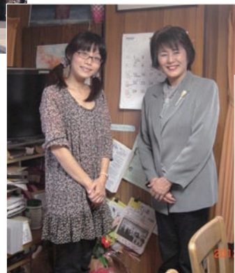
▲児童養護施設退所者支援団体のリーダーと