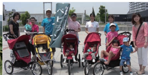
▲ランニングバギーを使ったエクササイズ教室「ベビワン」のメンバーと