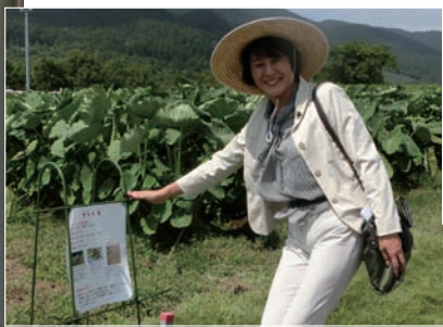
▼静岡県の自然農園を視察