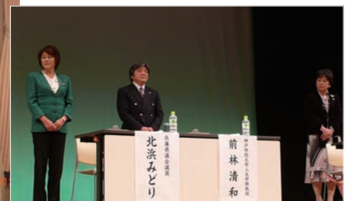
▲教育再生フォーラムのパネリストとして新たな教育のあり方を訴えました