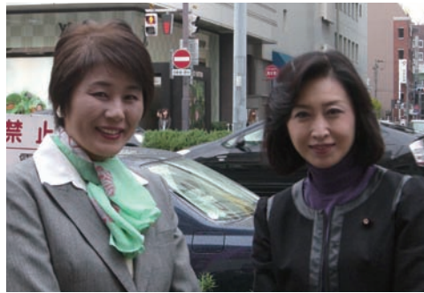
▲自民党女性局長の三原じゅん子参院議員と街頭演説