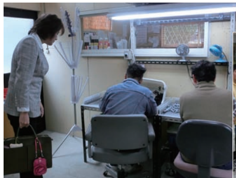
▲三田市にある知的障害者施設の作業所を訪問