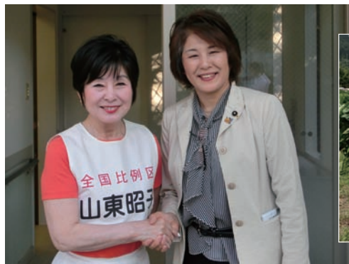
▲山形県参院議員と固い団結

称を変更しました。今後とも、神戸市との連携のもと、より効果的・効率的な県民サービスを提供していきます。