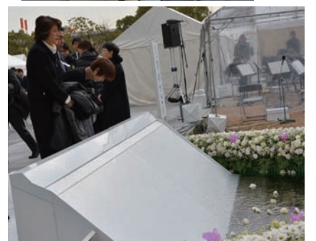
▲毎年1月17日には阪神・淡路大震災の追悼のつどいに参加